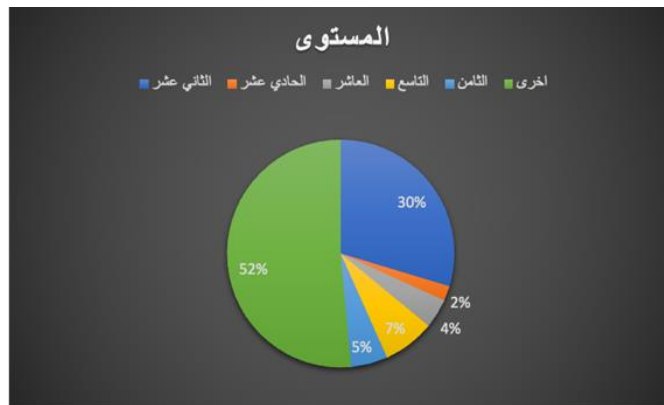
شكل (٣) يوضح المستوى الدراسي

يتناول الجدول رقم (٣) متغير المستوى الدراسي للعينة، ويمكن ملاحظة أن 23.14% من العينة ينتمون للصف الثاني عشر، بينما 1.64% ينتمون للصف الحادي عشر، و ٣.٢٨% ينتمون للصف العاشر، و ٥.٧٤% ينتمون للصف التاسع، و ٤.١٠% ينتمون للصف الثامن. وأخيراً، ينتمي 40.16% من العينة إلى مستوى دراسي آخر.